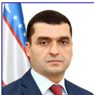
ASILBEK ANVAROVICH XUDAYAROV

O'zbekiston Respublikasi Sog'liqni saqlash vaziri