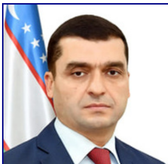
АСИЛБЕК АНВАРОВИЧ ХУДАЯРОВ

Министр здравоохранения Республики Узбекистан